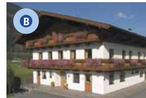
Appartements, Sanitäranlagen, Fitnessraum, Solarium, Skistall, Spielzimmer