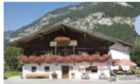
Café-Restaurant Seehof mit Sonnenterrasse und Kiosk (Brötchenservice, Imbisse usw.) Im Keller davon: Sanitäranlagen, Mülltrennung