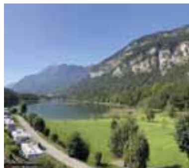
Privatliegewiese Camping Seehof

Strom, TV-Anschluss, Zu und Abwasser am Platz; gegenüber dem neuen Sanitärhaus