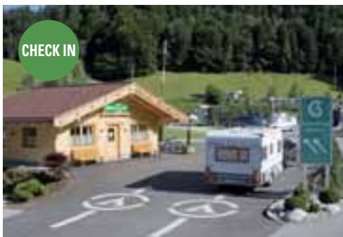
Einfahrt und Anmeldung

Innsbruck – Brixlegg – Kramsach ← → Breitenbach – Wörgl – Kufstein